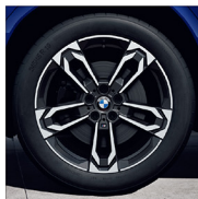
M 雙輻式 871M