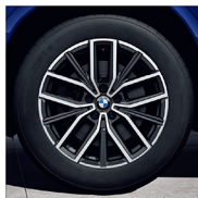
M 雙輻式 838M