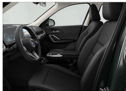
Veganza 透氣皮質 / 標準座椅 iX1 eDrive20 xLine