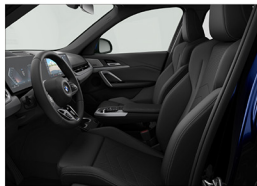
Veganza 透氣皮質 / 跑車座椅 X1 sDrive20i M Sport