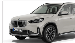
iX1 xDrive30 xLine