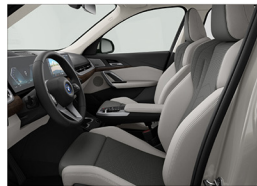
Veganza 透氣皮質 / 跑車座椅 iX1 xDrive30 xLine