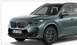
X1 sDrive18i M Sport