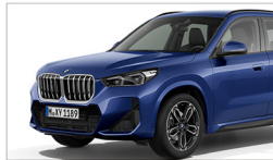
X1 sDrive20i M Sport