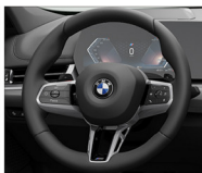
M 多功能真皮方向盤 (含換檔撥片)