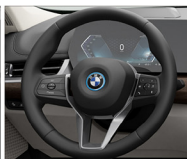
跑車多功能真皮方向盤