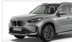
iX1 eDrive20 xLine