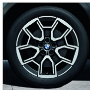
V 輻式 867