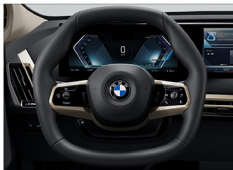
六角造型多功能方向盤 iX xDrive45 Excellence