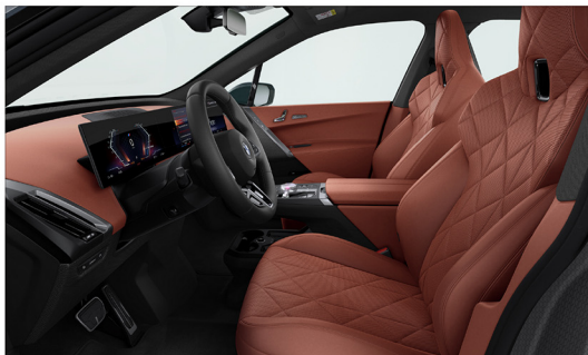
咖啡果皮鞣製天然真皮 / M 多功能跑車座椅 iX xDrive45 M Sport / iX xDrive60 M Sport