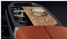
天然木紋搭配霧面銅色內裝飾條 iX xDrive45 Excellence