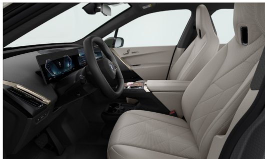
Sensotec 透氣皮質 / 多功能舒適型座椅 iX xDrive45 Excellence