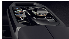
黑色高光澤搭配霧面深灰色內裝飾條 iX xDrive45 M Sport / iX xDrive60 M Sport