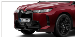
iX xDrive60 M Sport