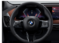
M 多功能真皮方向盤 iX xDrive45 M Sport / iX xDrive60 M Sport