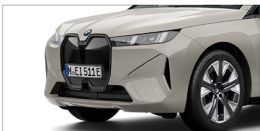
iX xDrive45 Excellence