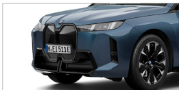
iX xDrive45 M Sport