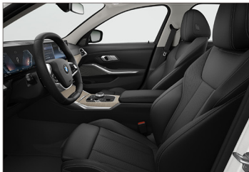
Sensotec 透氣皮質 / 跑車座椅 318i Sport