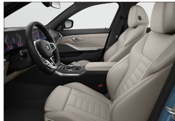
Vernasco 真皮 / 跑車座椅 330i M Sport