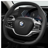
六角造型真皮方向盤 (含換檔撥片)