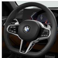
M Nappa 真皮平底方向盤 (含換檔撥片)