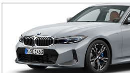
320i M Sport