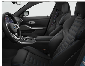
Vernasca 真皮內裝 / M 雙前座跑車座椅 M 縫線安全帶 / 雙前座電動腰靠