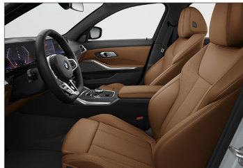
Sensotec 透氣皮質 / 跑車座椅 320i M Sport