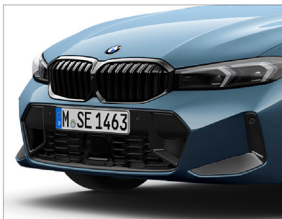
黑色高光澤外觀套件 / 燻黑造型頭燈

330i M Sport 提供優惠 11 萬升級 Racing Package，原選配價：18.3 萬