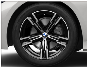
M 雙輻式 848M 輪圈: 7.5J X 18 輪胎: 225 / 45 R18