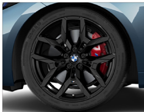
M 雙輻式 995M / M 煞車套件 (紅色) 輪圈：8J X 19 / 8.5J X 19 輪胎：225 / 40 R19 255 / 35 R19