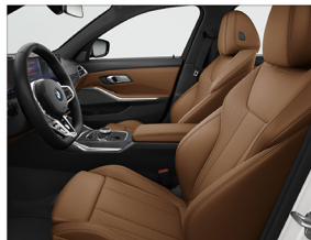
Sensatec 透氣皮質 / 跑車座椅 M Nappa 真皮平底方向盤 / 黑色車內頂篷