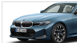
330i M Sport