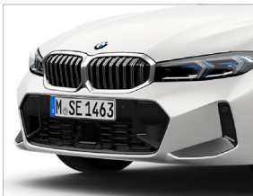
M 空力套件 / 鍍鉻水箱護罩搭配霧銀雙肋直槽