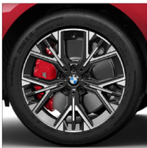
M Y 輻式 975M