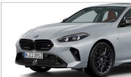
M235 xDrive Racing Edition