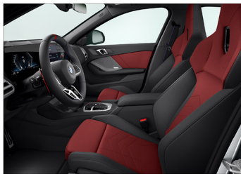
Veganza 透氣皮質 / M 跑車座椅 M235 xDrive Racing Edition