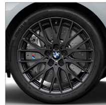
M 鍛造 Y 輻式 1085M