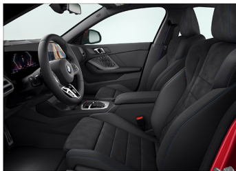
Veganza 透氣皮質 / Alcantara 麂皮 / 跑車座椅 220 M Racing Edition