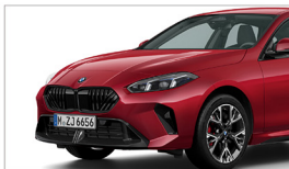
220 M Racing Edition