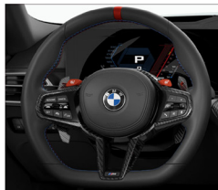
M Nappa 真皮平底方向盤含專屬縫線