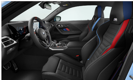
Vernasca 真皮 / M 跑車座椅