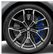
M 雙輻式 930 M