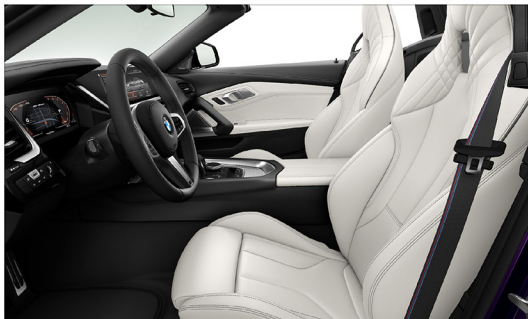
Vernasco 真皮 / M 跑車座椅 Z4 M40i