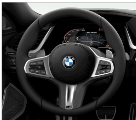
M多功能真皮方向盤 (含換檔撥片)