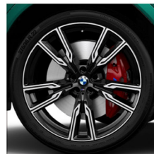
M V 輻式 747 M