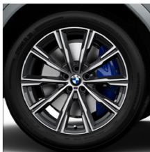
M 星輻式 740 M