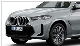
X6 xDrive40i M Sport