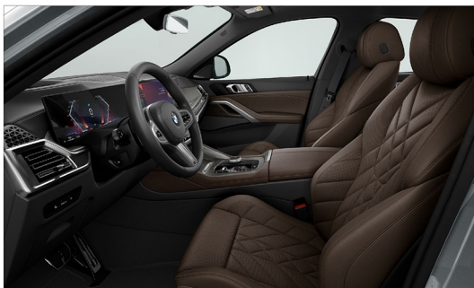
SensaFin 透氣皮質 / 跑車座椅 X6 xDrive40i M Sport