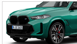
X6 M60i xDrive