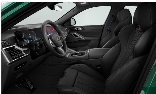
BMW Individual Merino 真皮 / M 跑車座椅 X6 M60i xDrive