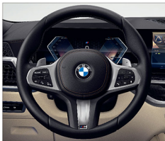
M 多功能真皮方向盤 (含換檔撥片)