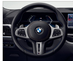
M 多功能真皮方向盤搭配專屬縫線 (含換檔撥片)