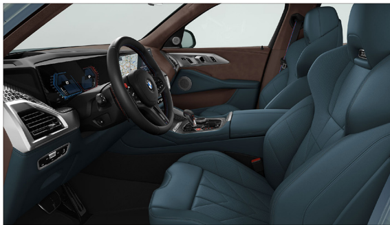
BMW Individual Merino 真皮 / M 雙前座跑車座椅搭配專屬發光字樣