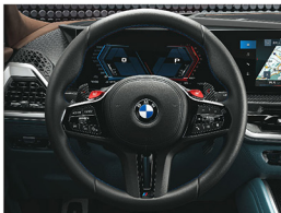
M 多功能真皮方向盤搭配專屬縫線(含碳纖維換檔撥片)