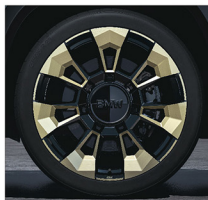
M 星輻式 923M