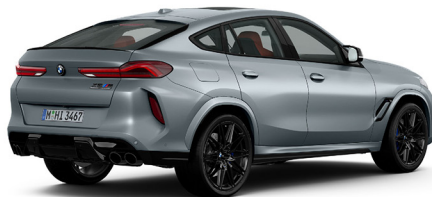
X6 M Competition