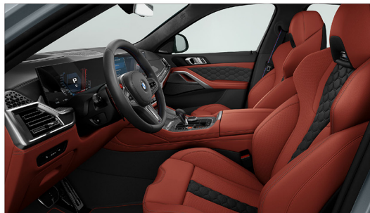
Merino 真皮 / M 雙前座跑車座椅搭配專屬發光字樣 X6 M Competition