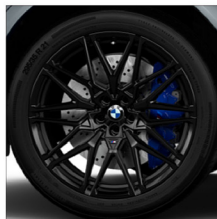
M星輻式 818 M