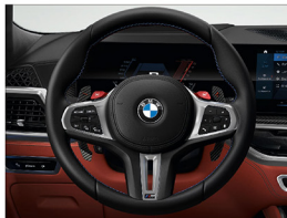
M 多功能真皮方向盤搭配專屬縫線 (含碳纖維換檔撥片)