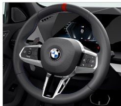
M 多功能真皮方向盤搭配專屬縫線 (含換檔撥片)