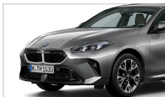
120 M Sport