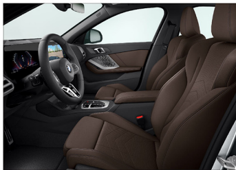
Veganza 透氣皮質 / 跑車座椅 120 M Sport