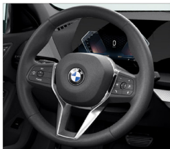
跑車多功能方向盤