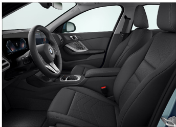
Veganza 透氣皮質 / 標準座椅 120 Sport