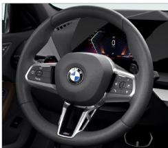
M 多功能真皮方向盤 (含換檔撥片)