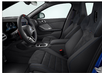
Veganza 透氣皮質 / Alcantara 麂皮 / M 跑車座椅 M135 xDrive