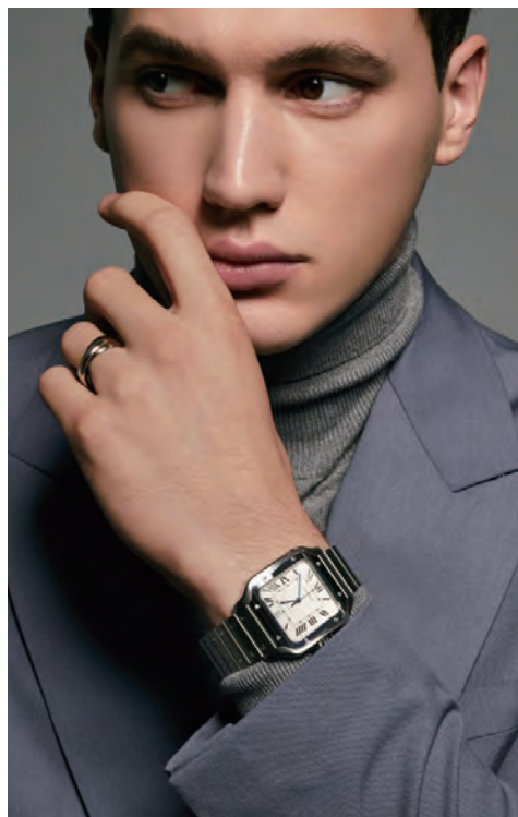
(上) Cartier 追求簡約線條、精確造型與精緻細節，成就歷久彌新的設計傑作。 (左) Tank Must 腕錶是 Cartier 的經典錶款之一。