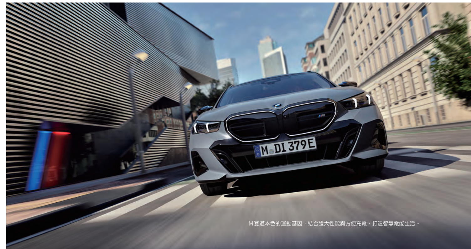
M賽道本色的運動基因，結合強大性能與方便充電，打造智慧電能生活。

性能代表i5 M60 xDrive Touring車型，藉由前後軸的同步式電動馬達發揮，最大馬力可榨出601匹之譜，峰值扭矩高達