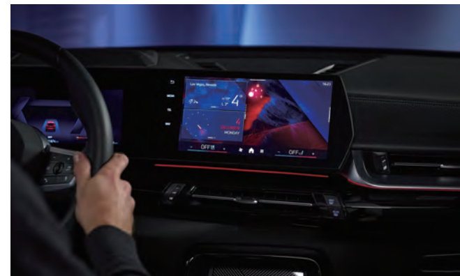
2024CES 展示了 BMW 透過全新智能語音助理，讓駕駛可以在車內得知所有車輛功能。

在 2024 CES 中，BMW 展示首度使用 AR 擴增實境眼鏡，參觀者戴上 XREAL Air 2 智能眼鏡，就能在真實視野中再獲取道路導航資訊、危險警告、停車場、充電站等相關訊息，將情境融入現實世界環境裡。隨著相關技術進步、使用門檻降低，AR