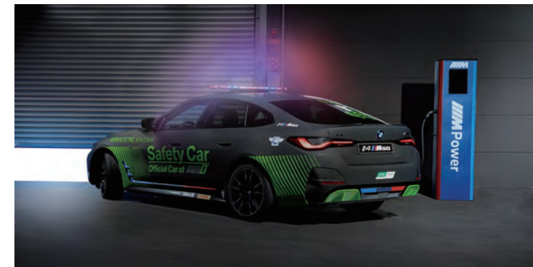
以純電力驅動的 BMW i4 M50 安全車，完美貼合賽事主題，展現運動性、動力性與動態性。

接棒 FIM Enel MotoE 賽事先前的 i8 安全車任務，BMW i4 M50 以純電力驅動的身分，完美貼合賽事主題。透過前後軸的兩具 BMW M eDrive 電動馬達驅動與 Sport Boost 運動增壓模式，最高可具備 544 匹最大馬力，僅需 3.9 秒就可從靜止加速至時速 100 公里。一如 BMW 始終堅持的造車精神，BMW i4 M50 同樣擁有接近 50:50 的前後完美配重，更有 M 跑車化電子懸吊套件、可變式運動轉向系統、M 煞車套件等，不僅擁有引領賽車前行的最佳實例，於一般道路上也創造成最經典與為人讚譽的 BMW M 駕馭體驗。