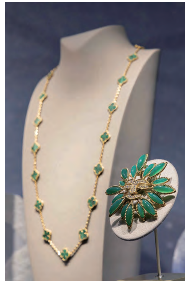
綠松石是維多利亞女王最喜愛的寶石之一，Van Cleef Arpels 整體設計力量感與優雅感兼具。