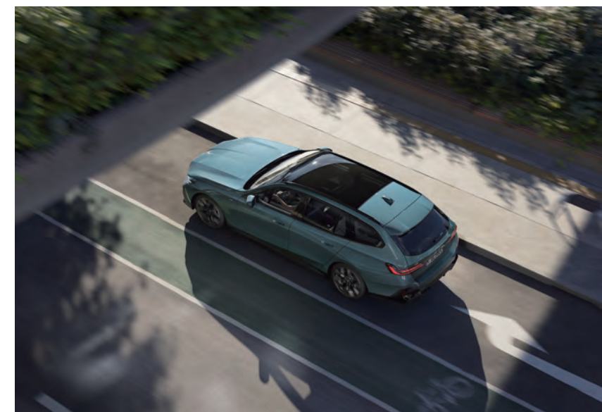
愜意旅程 全新純電豪華旅行車再造新局