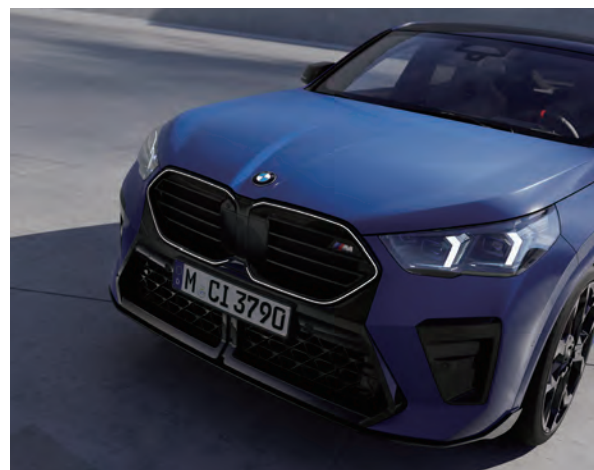
BMW飾光水箱護罩結合專屬六角形雙腎型水箱護罩的剛硬輪廓，與兩側光型變化的智慧LED頭燈完美對應。

率先引進的全新BMW X2豪華跑旅，共區分為BMW X2 sDrive20i M Sport、BMW X2 M35i xDrive，以及iX2 xDrive30 M