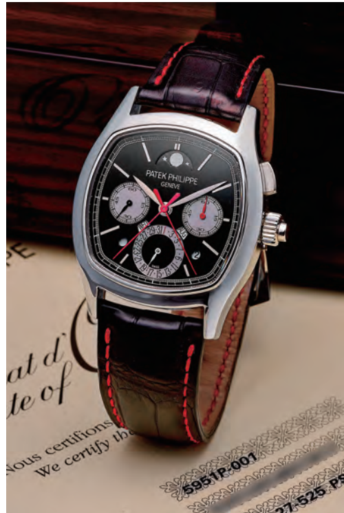
Patek Philippe 5951P 鉑金枕形腕錶，展現製錶工藝。

若說老錢風腕錶的精髓在於細節，那麼百達翡麗（Patek Philippe）必定是這些貴族世家的最愛，像是百達翡麗的鉑金三問萬年曆陀飛輪腕錶，乍看外形並不張揚，但實際卻由昂貴的鉑金，疊加萬年曆、陀飛輪、三問等多項複雜功能，非常考驗製錶工藝，只有懂的人才會知道價格要上千萬元。