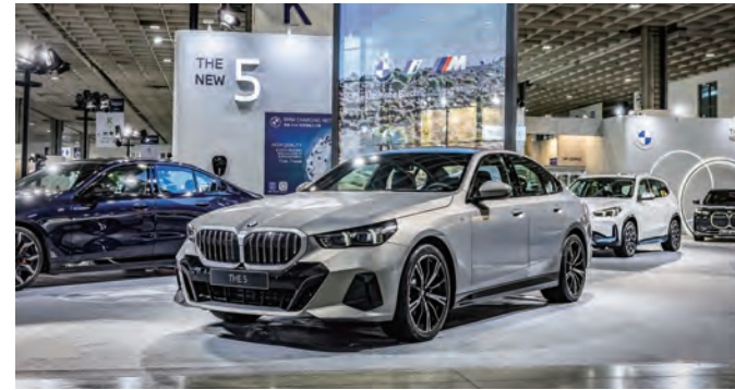
疫情後規模最大的台北新車大展，BMW展現深耕永續目標，為純電市場注入新氣象。