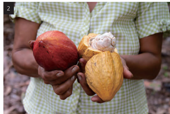
1. 瀑布群景觀壯闊，令人讚嘆大自然的巧奪天工。 2. 體驗可可豆到巧克力的製程，滿足挑剔味蕾。

Cotococha社區，體驗居民最貼近大自然的生活，嘗試像「泰山」一樣在叢林中以繩索擺盪的電影經典畫面，徜徉在吊床上午睡，被叢林擁抱的滋味。熱帶雨林氣候最適合可可種植，親身體驗Bean to Bar從可可豆到巧克力的製程，雙重滿足了味蕾和愛探險的心。