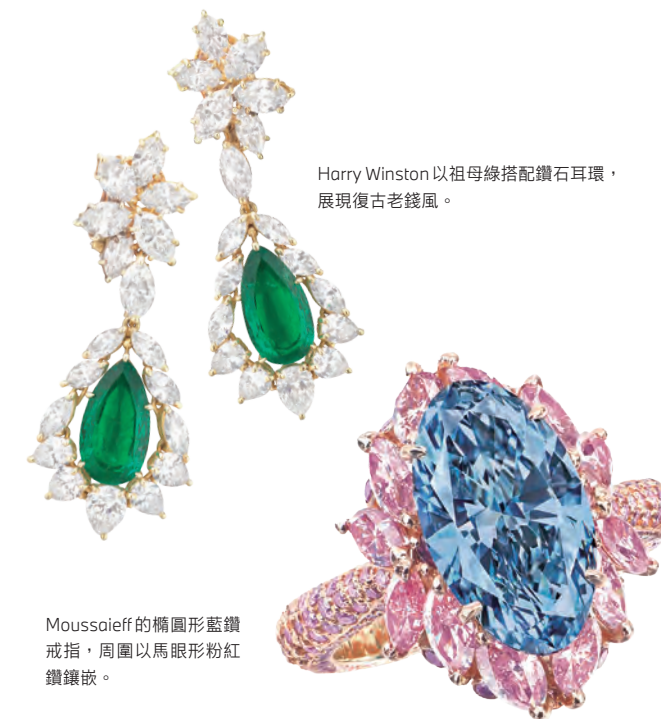
Harry Winston 以祖母綠搭配鑽石耳環，展現復古老錢風。