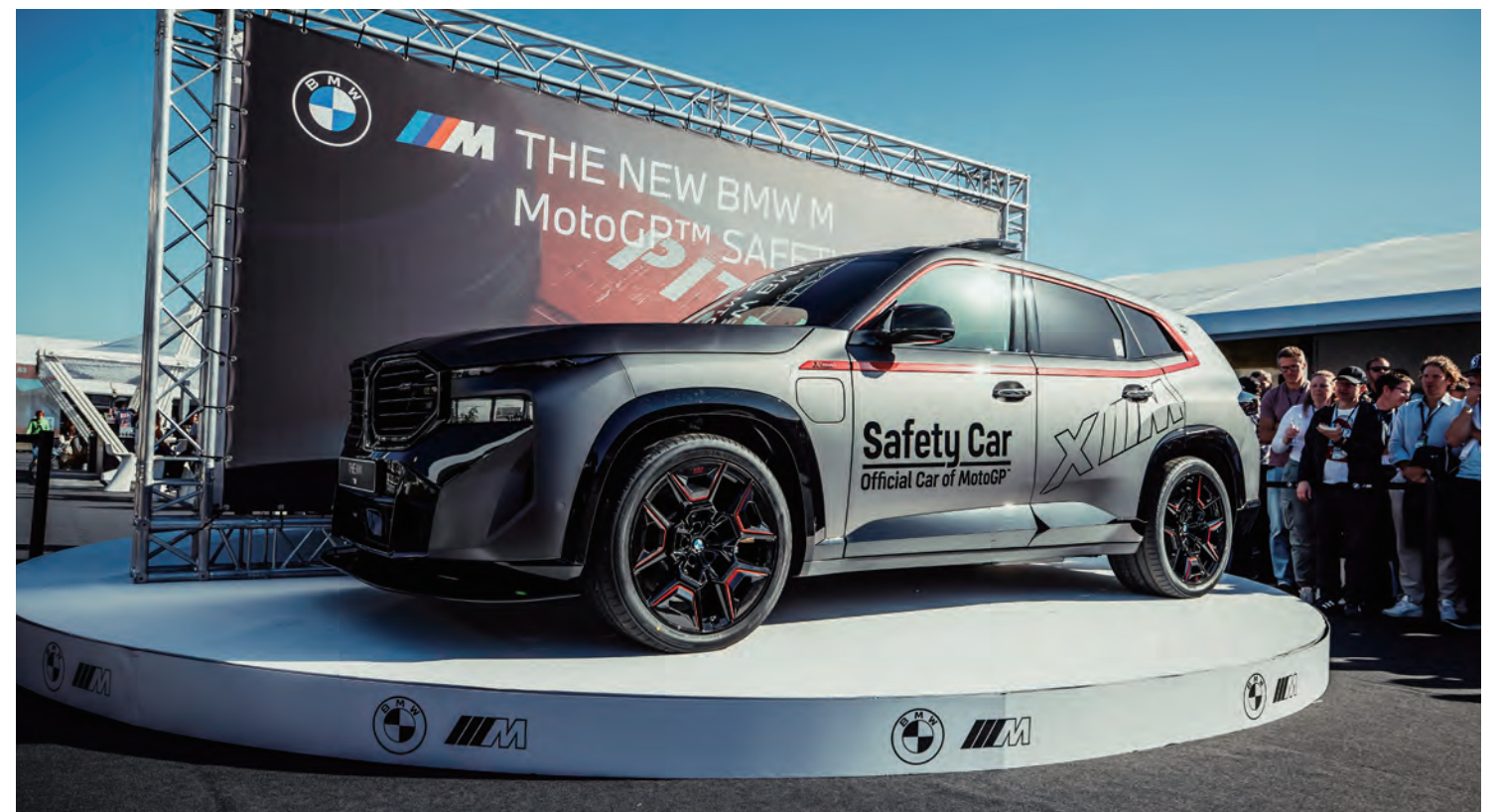
BMW XM Label Red 是 MotoGP 賽場上首款具備電力驅動系統的安全車。