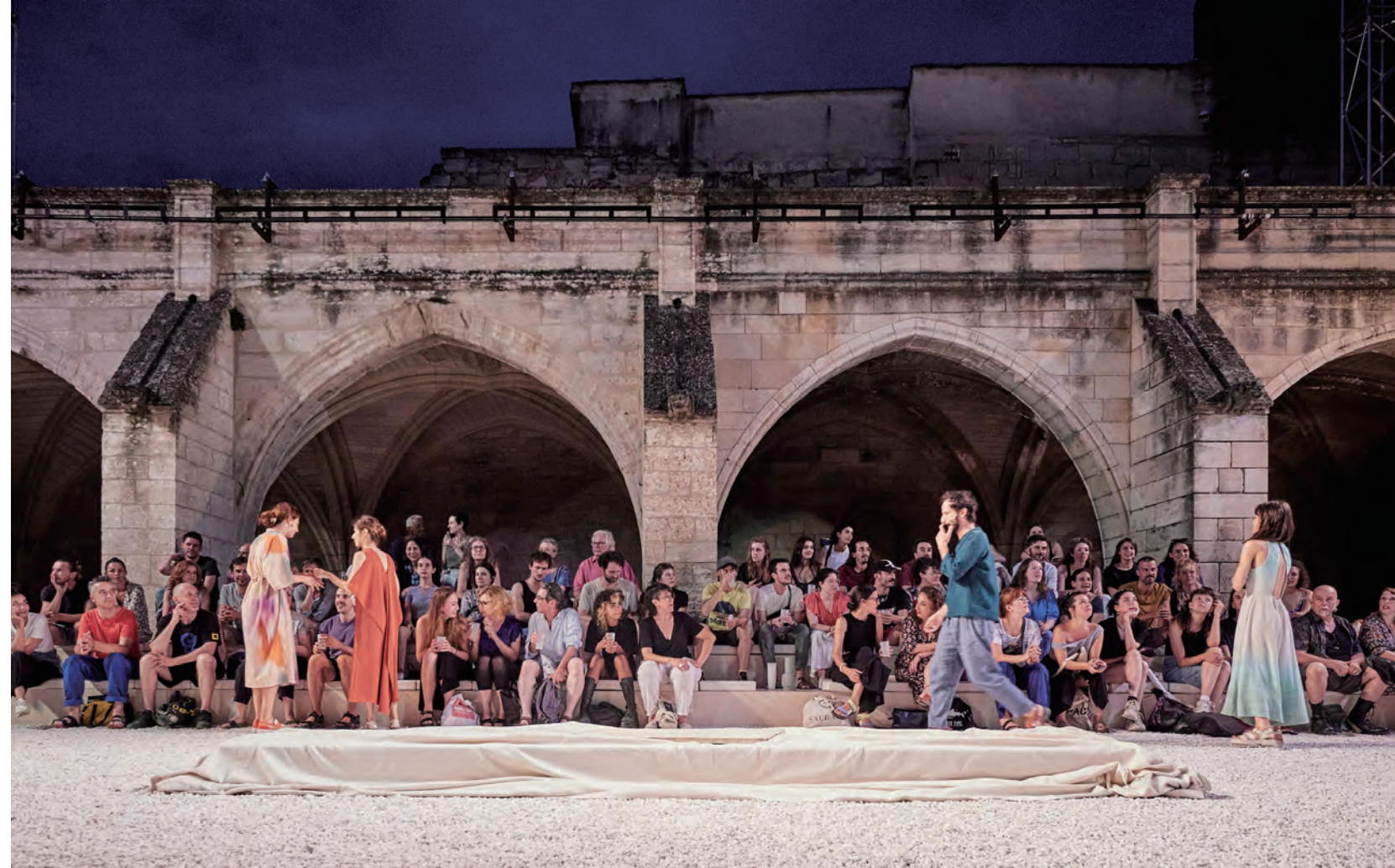
亞維儂小鎮在6-7月藝術節舉辦期間，將吸引許多旅客到訪，精采演出目不暇給。