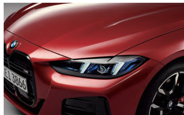
纖薄的頭燈帶來嶄新的燈型設計，前衛的雙腎型水箱護罩不僅凸顯獨特，更展現自信氣勢。

最新一代的方向盤設計，也融入此次全新4系列雙門跑車與敞篷跑車座艙，觸感細緻的M Nappa真皮，結合平底式設計搭配M品牌專屬廠徽與後方的換檔撥片，成為了勾動駕駛欲念的最佳配備。