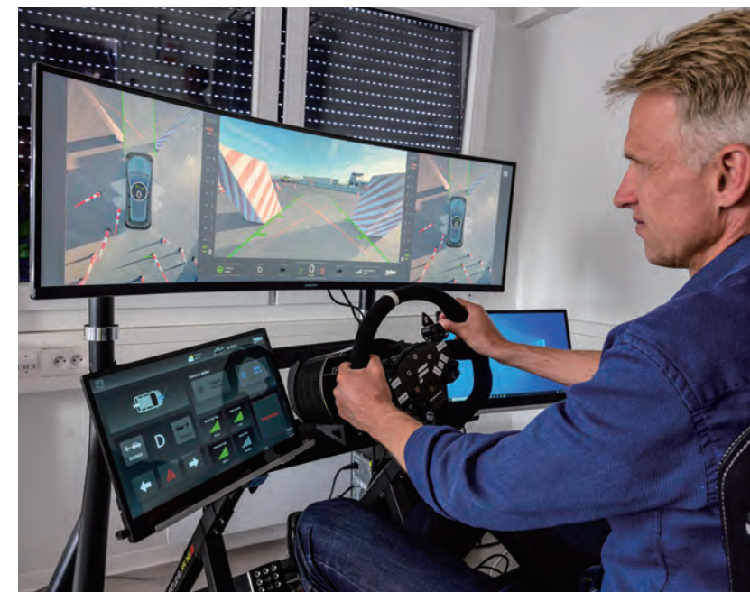
自動代客泊車系統透過遠端遙控，展現未來無人駕駛的新停車體驗。

什麼是汽車？相信你知之甚詳。然而，隨著時代變遷、科技進化，汽車可以幫助人類實現多少想法？為生活增添多少色彩？看完 BMW 在 2024 CES 的精湛展出，答案昭然若揭。