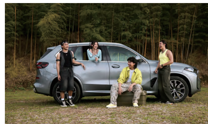
跟著美秀集團野營趣