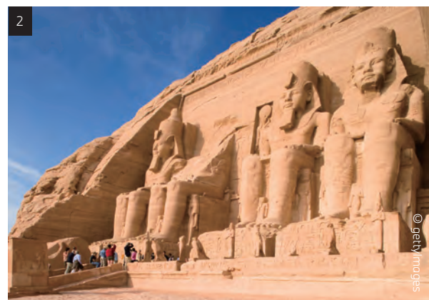
1. 酒店設施完備，富麗堂皇的泳池展現阿拉伯迷人風情。 2. 一覽位於埃及南部的阿布辛貝巨型神廟，依崖鑿建的神廟深處別有洞天。