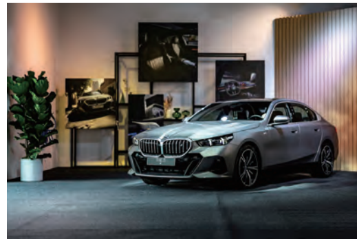
首款全新BMW i5純電豪華房車，同步感受德國的新世代科技與豪華饗宴。

屬「5」字樣、懸浮式曲面螢幕、BMW Operating System 8.5結合全新QuickSelect快捷選單、旗艦級BMW座艙環繞光幕、AR擴增實境導航、豪華品牌中唯一的變換車道輔助功能與BMW手機數位鑰匙2.0，全面列為BMW i5純電豪華房車標準配備。從細節預見全新BMW 5系列擁抱未來的新穎之姿，展現精湛設計工藝，寫下傲視級距的傳奇篇章。