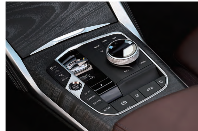
(上)BMW雷射尾燈燈型源自BMW M4 CSL車型，創造驚艷且不可錯認的獨特光型。 (下)排檔桿輕鬆切換檔位，擁有時尚外觀，創造座艙內的現代感。