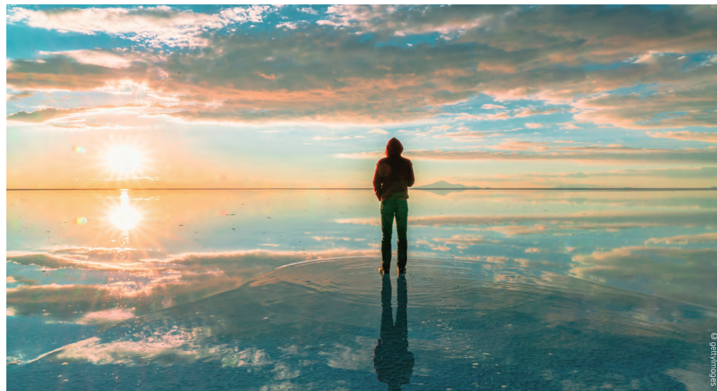
積水反射出藍天白雲與夕陽，如同一面為天空打造的鏡子。