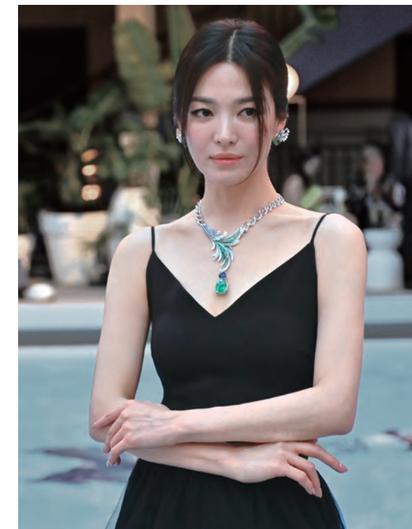
韓星宋慧喬出席 CHAUMET 貴賓晚宴，配戴祖母綠套鍊。

被稱作鑽石之王的海瑞溫斯頓，骨子裡就自帶老錢風特質，運用各種各樣的珍稀大顆寶石，像是哥倫比亞天然祖母綠配鑽石吊墜耳環，顏色和切割的形狀都走復古風，表現滿滿老錢風標誌。至於梵克雅寶 (Van Cleef Arpels) 綠松石項鍊，採經典設計，由於綠松石是維多利亞女王最喜愛的寶石之一，在維多利亞時代也是真愛的象徵，將圓形和梨形蛋面綠松石融於設計中，提升整體格調，力量感與優雅感兼具。