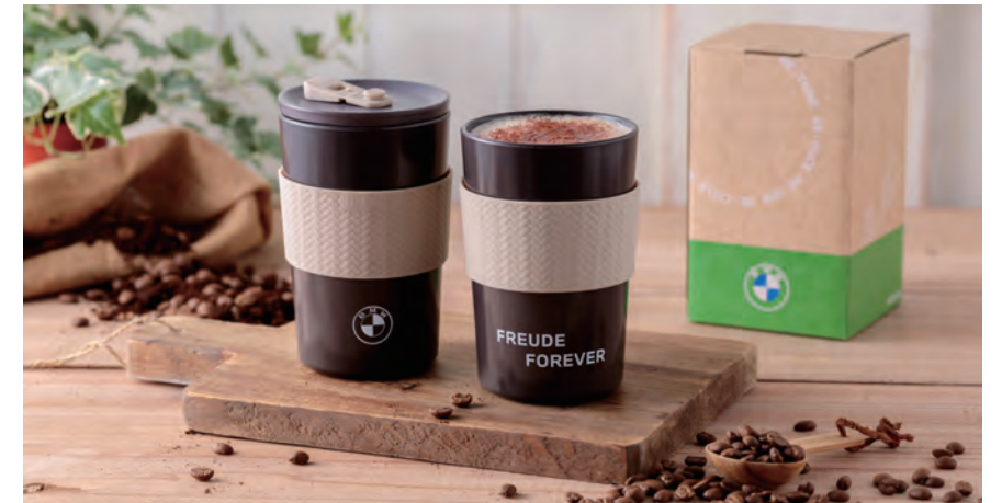
BMW總代理汎德讓永續走入生活，以竹纖維搭配咖啡渣，創造出結合在地關懷與設計思考的永續隨行杯。