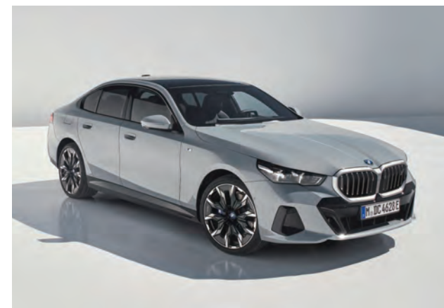
優雅低調的i5，從內而外展現高貴的氣質。

例如 LED 光條尾燈，不僅在復古中點綴出一絲的現代感，還有復古風格真皮包覆內裝，像是 XM 專屬復古風格真皮包覆，讓色彩營造出時尚感，也表現出座艙的高級氛圍，增添優雅氣息。