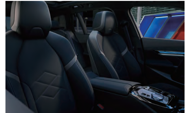
M Veganza透氣皮質跑車座椅提供了絕佳包覆性，在高速競駛的狀態下，仍保有豪華駕駛的舒適性。

藉由嶄新電能與超越框架的創新格局，全新BMW i5 Touring純電豪華旅行車不僅豐富了旅途中之移動樂趣，更將移動過程的碳足跡降至最低，展現對於環境永續的尊敬。嶄新的豪華旅行意義，由全新BMW i5 Touring純電豪華旅行車來定義。