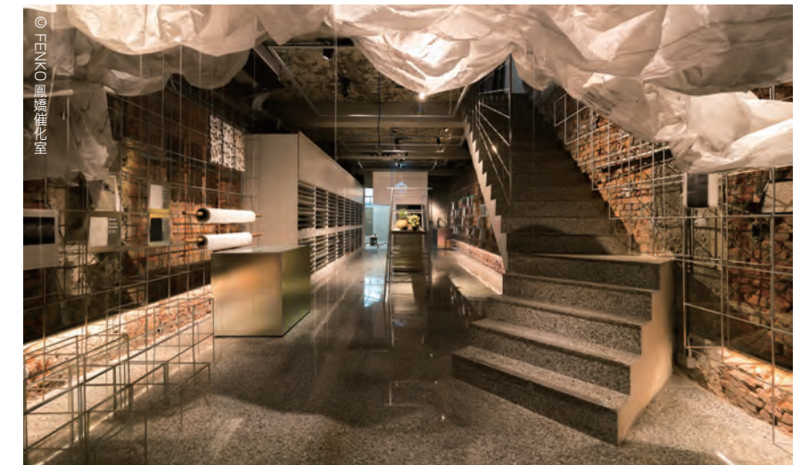
FENKO鳳嬌催化室是紙張創意催化的實驗場，也展售鳳嬌選紙。品牌獲日本「GOOD DESIGN AWARD」設計獎，空間曾獲「台北老屋新生大獎」。

覺，能自由地駕馭。BMW踩油門的感覺很奔放，有些車就是給人穩重感，但BMW除了穩重外，還會有一種不可控但又在控制範圍內的感覺，這感覺很棒。」