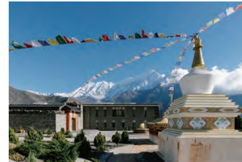
BMW串起從塵囂到世外桃源的路程