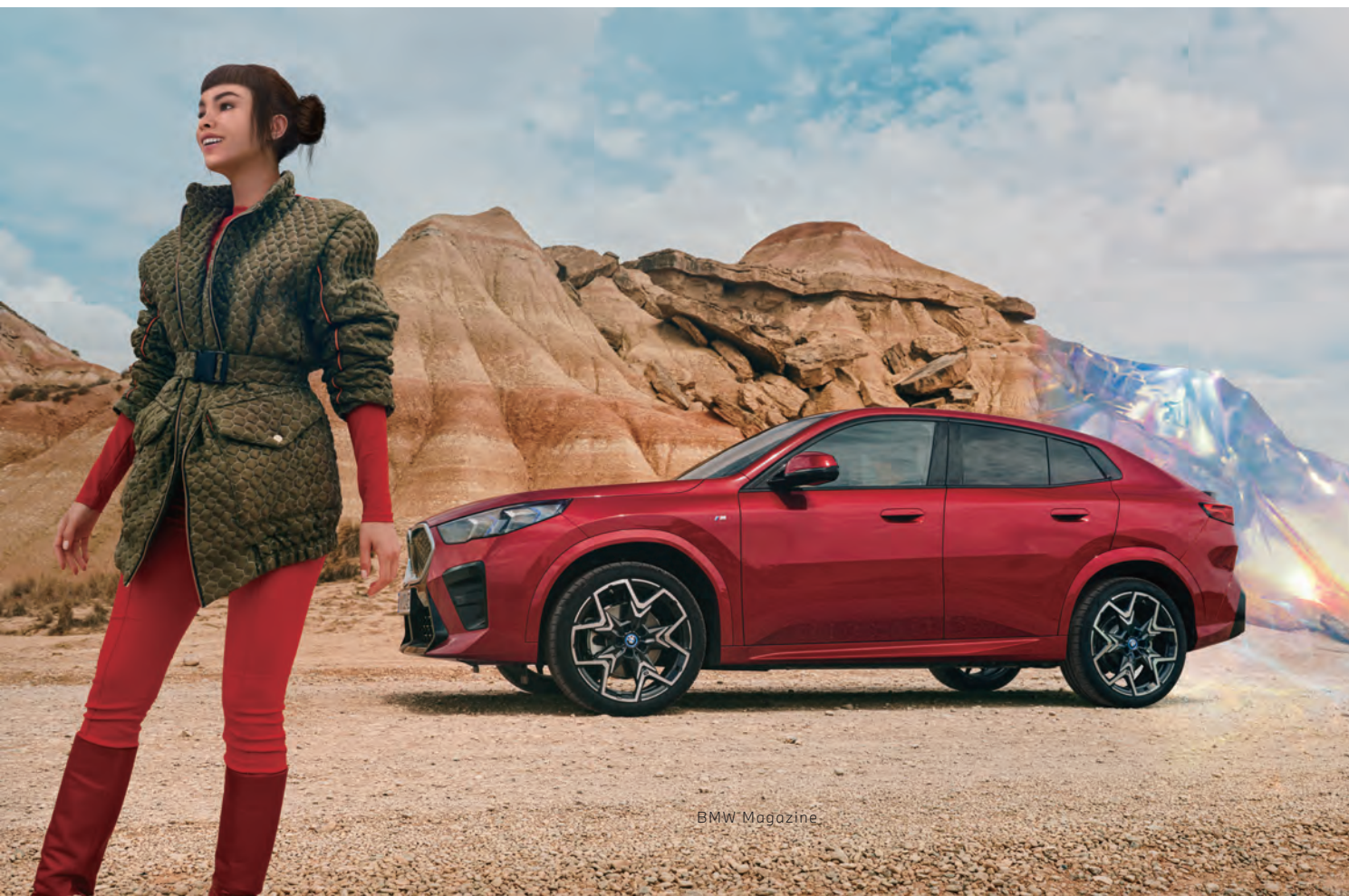
iX2展現智能純電風采，以開邁之姿帶領暢行，449公里的續航里程，悠然征服旅程與挑戰。

全新BMW X2豪華跑旅與iX2純電豪華跑旅同步於BMW德國Regensburg工廠生產，除了高效且靈活的先進生產流程以外，更透過綠色能源與利用再生資源的製程科技，確實降低車輛整個生命週期所產生的碳足跡，在滿足民眾對於駕駛樂趣與豐富用車生活的期待之際，也盡可能地減少對於地球環境的負擔，邁向永續發展的未來願景。