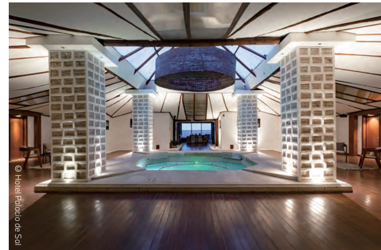
現存最古老的鹽酒店，以鹽磚打造別具特色的宮殿。

在烏尤尼鹽沼的周圍，以多家「鹽酒店」最具特色，最早的一家建於1993年，因為管理不善而拆除，而後於2007年打造的Palacio De Sal，在西班牙語的意思是「鹽的宮殿」，是目前現存最古老的鹽酒店，用1萬個鹽磚打造，舉凡地板、牆壁、天花板、家具（包含床、桌子、椅子、雕塑等）都是用鹽製成，並設有桑拿、蒸氣室及鹽浴池。水療中心以當地可得的鹽、藜麥作為素材，設計了一系列的放鬆舒緩計畫，當中還存有一條與其他奢華酒店不同的特殊規定：「不能舔牆壁」，用來防止以鹽製成的牆壁退化。