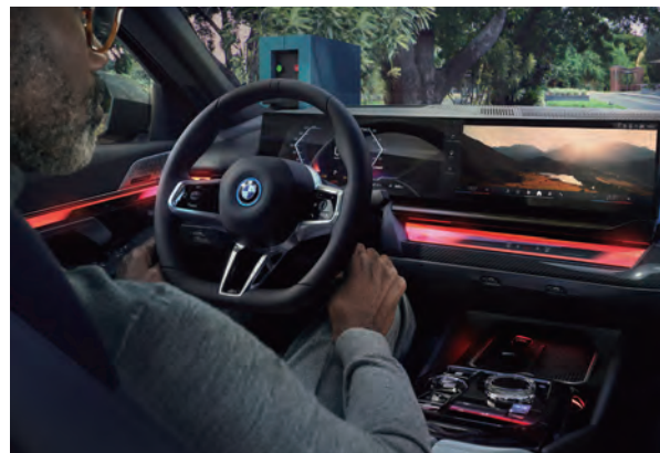
虛擬數位儀錶搭配中控觸控螢幕所構成的懸浮式曲面螢幕，展現駕駛導向設計與駕駛樂趣。

駕駛空間。光線的運用，在座艙內同樣展現創意，配備BMW環繞光幕、環艙氣氛燈組與頂級水晶中控套件，無論是想要靜謐沉浸的座艙氛圍，還是熱血動感的車室感受，只要快速切換就可迅速達成。