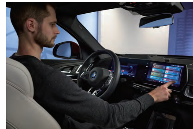
全新發表的Operating System 9透過BMW Digital Premium與ConnectedDrive Store結合，提供一系列應用程式。

於美國拉斯維加斯舉行的CES消費電子大展，是全球規模最盛大的電子產品貿易展，每年吸引世界各地電子產業至此共襄盛舉。隨著汽車產業邁入嶄新電能時代，CES成為汽車科技展露頭角的大舞台，而每次BMW總能為全球車壇掀起科技風潮。