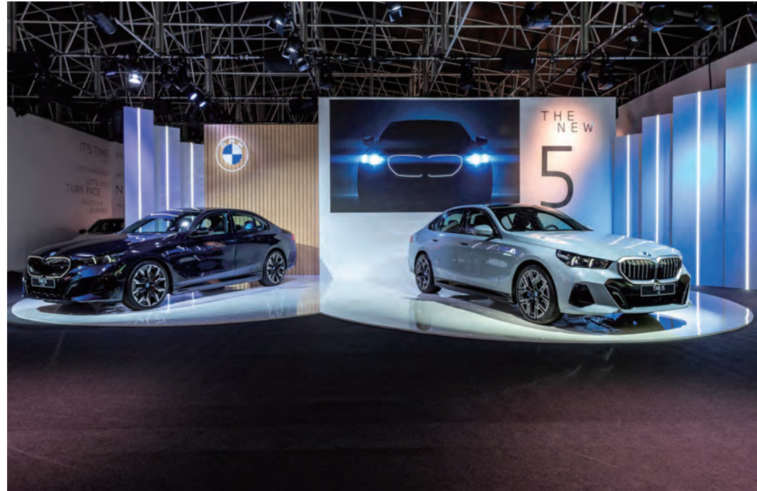
全新第8代BMW 5系列，描繪下個世代的智慧移動生活，寫下傲視級距的傳奇篇章。

對地球友善，是BMW努力不懈的目標，無論是最新發表的BMW i5純電豪華房車，或是在2024台北新車暨新能源車特展上，展示BMW總代理汎德是如何規劃台灣充電網，讓未來純電車的生活能加便利，到回收利用咖啡渣打造永續隨行杯，都顯示出「永續發展」的決心，更是BMW品牌堅定的使命。