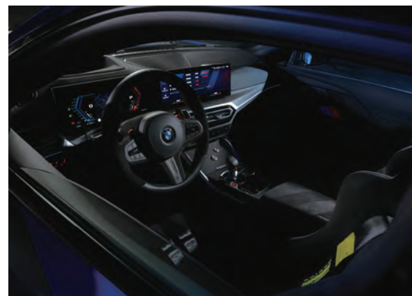
全新世代 BMW M2 安裝 RECARO 賽車椅、6 點式安全帶，完美擔任賽場上的安全車任務，展現毫不遜色的性能氣勢。

要能完美擔任 MotoGP 賽場上的安全車任務，全新世代 BMW M2 更安裝了許多必備套件，包含防滾籠、RECARO 賽車椅、6 點式安全帶、滅火器、車頂桿與搭配的前方照明燈組等；同時 BMW M Performance Parts 中的排氣系統、底盤套件、碳纖維後視鏡外蓋、分流器與尾翼等也全數上身，搭配專屬塗裝，對比 MotoGP 賽場上兩輪賽車們，此輛全新世代 BMW M2 安全車展現毫不遜色的性能氣勢。