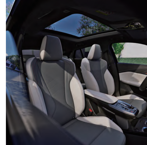
符合人體工學的座椅，提供完美舒適支撐，且能輕鬆電動調整，享受個人化的豪華體驗。