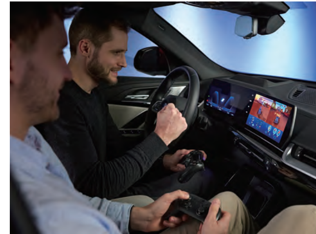
透過車載遊戲平台在車內大玩經典電玩，除了單人也能進行多人遊戲。

伴隨著更強大的 BMW Operating System 9 問世，新一代 BMW 智慧語音助理將提供優質體驗，並與合作夥伴持續精進 LLM 功能，盡快落實於 BMW 旗下車款。