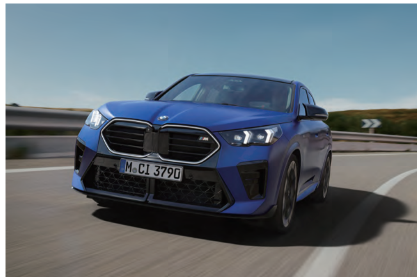
再揭跑旅新浪潮 率性進化登場