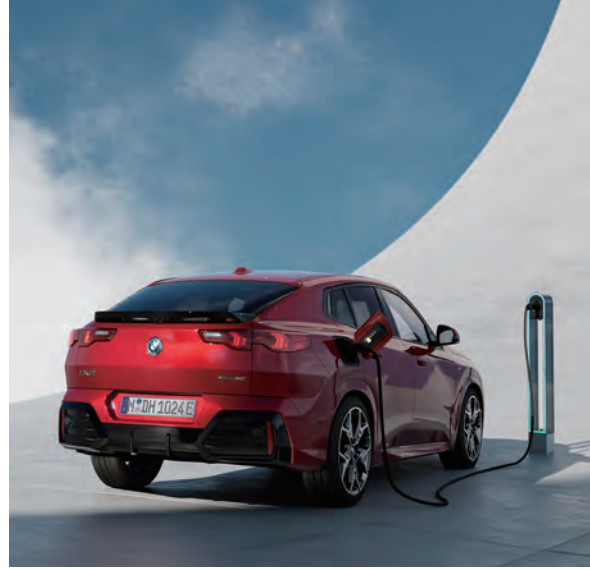
完整的BMW i高速充電網，提供電動車車主功率最高的充電設備。

全新BMW X2豪華跑旅依舊展現對於安全的高度重視，全車系皆搭載最新世代BMW Personal CoPilot智慧駕駛輔助科技，將最先進的變換車道輔助、智慧駕駛輔助科技以及360度環景輔助攝影等功能列為標準配備，當然，也包含主動防撞輔助系統與行人偵測、主動車距定速控制系統、壅塞交通輔助、車側防撞輔助、路口車流防撞輔助、閃避轉向輔助、盲點偵測警示、車道偏離警示、前後方車流警示、後方防追